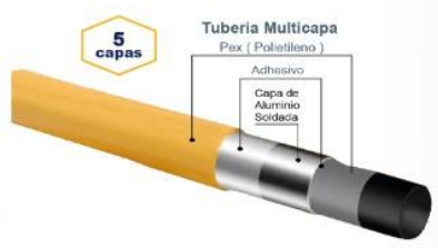
5 capas Tubería Multicapa Pex ( Polietileno ) Adhesivo Capa de Aluminio Soldada