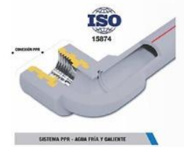
SISTEMA PPR - AGUA FRÍA Y CALIENTE