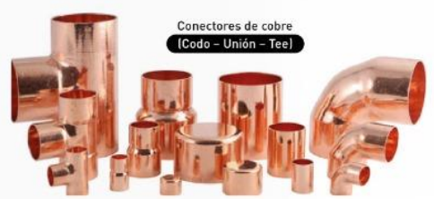
Conectores de cobre (Codo - Unión - Tee)