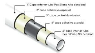
1° Capa exterior tubo Pex Silano Alta densidad 2° capa adhesivo especial 3° capa central de aluminio 4° capa adhesivo especial 5° capa interior tubo Pex Silano | Alta densidad